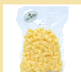
BATATA EM CUBOS 300g