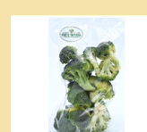
BRÓCOLIS AMERICANO 250g