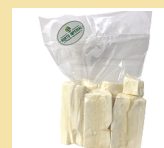
MANDIOCA DESCASCADA 600g