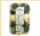
YAKISOBA 300g (Repolho verde, roxo, cenoura, brócolis americano e couve- flor)