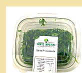
SALSA HIGIENIZADA 70g