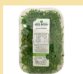
COUVE FATIADA 180g