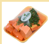
ABÓBORA PEDAÇOS 400g