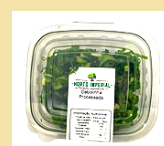
CEBOLINHA HIGIENIZADA 70g