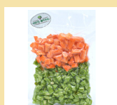
VAGEM COM CENOURA 300g