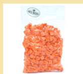
CENOURA EM CUBOS 300g