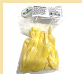
BATATA ASTERIX PALITO 300g