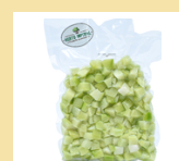
CHUCHU EM CUBOS 300g