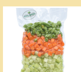
SELETO DE LEGUMES (Chuchu, cenoura e vagem) 300g