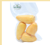
BATATA BAROA DESCASCADA 500g