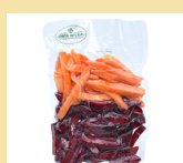
BETERRABA C/ CENOURA EM PALITOS 300g