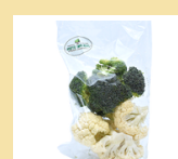
BRÓCOLIS COM COUVE-FLORES 250g