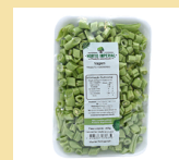
VAGEM HIGIENIZADA 300g