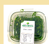
CHEIRO-VERDE HIGIENIZADO 70g