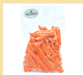
CENOURA EM PALITOS 300g