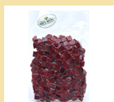
BETERRABA EM CUBOS 300g