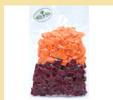
BETERRABA C/ CENOURA EM CUBOS 300g