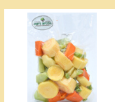
SOPÃO 500G (Batata, batata baroa, cenoura, chuchu e vagem)