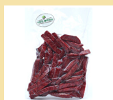
BETERRABA EM PALITOS 300g