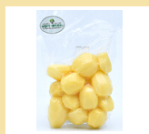
BATATA CALABRESA DESCASCADA 500g